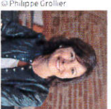
Carole Delga Présidente de la Région Occitanie / Pyrénées-Midi-Pyrénées

« Le coût de la scolarité ne doit pas être un frein pour réussir ses études, alors la Région améliore le pouvoir d'achat des familles avec la Carte Jeune : livres gratuits, l'équipement "pro" gratuit, ordinateur portable... La Carte Jeune c'est l'atout gagnant. »